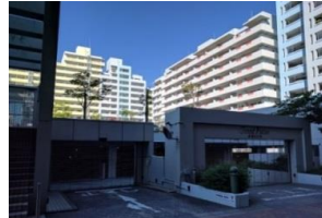
車種を選ばない自走式駐車場は理想の形