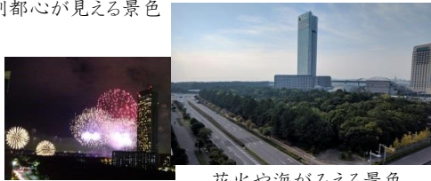
花火や海がみえる景色