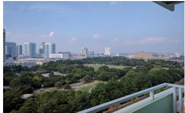
幕張海浜公園が見える景色