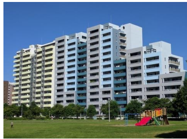
南側は大きな公園、北側は緑豊かな幕張海浜公園

「グランパティオス」と呼ばれる高層型パティオス、ペイタウンを象徴するデザイン ペイタウンの玄関口に位置し、駅からも近いのが特徴 免震構造であり、東日本大震災でも耐震性に対する効果が確認されています